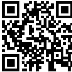
解除方法の動画QRコード