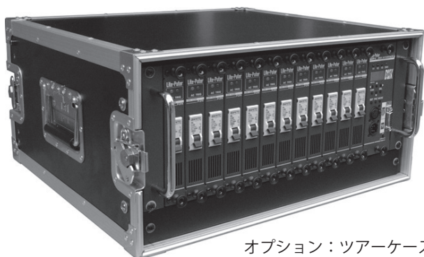
オプション：ツアーケース